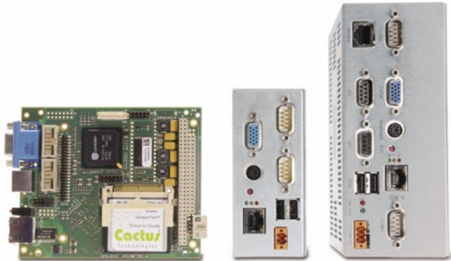
Abbildung 1: Mit den Retrofit-Lösungen von Syslogic lassen sich nicht mehr produzierte Systeme ersetzen, ohne dass Softwareanpassungen nötig werden.

Neben den Schnittstellen sind für Retrofit-Rechner insbesondere skalierbare Plattformen von grosser Bedeutung. Nur so lassen sich tiefe Taktfrequenzen bis zu 60 Megahertz realisieren, welche für so genannte RTOS (Real-time Operating System) benötigt werden, da diese von der Taktfrequenz abhängig sind.