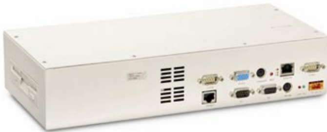
Abbildung 2: Eines der kundenspezifischen Retrofit-Geräte, das der Hersteller Syslogic mit einer Floppy-Schnittstelle ausgerüstet hat.

beträchtlich verlängert werden konnte. Um die bestehende Software einzulesen, wurden die Rechner mit einer Floppy-Schnittstelle ausgestattet. Dank der skalierbaren VortexDX-Prozessorplattform konnten die Programme zur Steuerung der Anlage problemlos implementiert werden. Positiv auf die Zuverlässigkeit der Gesamtanlage wirkt sich zudem die höhere Belastbarkeit und Lebensdauer der Retrofit-Systeme aus.